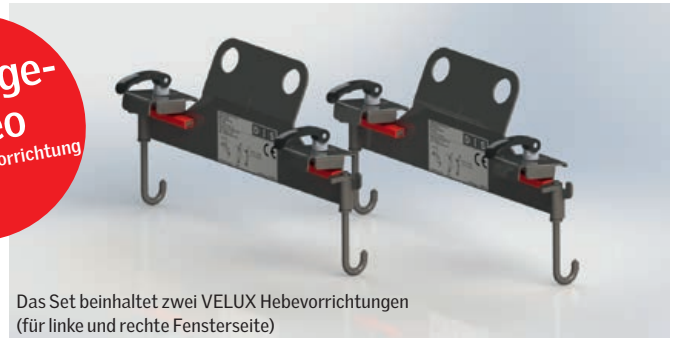
Das Set beinhaltet zwei VELUX Hebevorrichtungen (für linke und rechte Fensterseite)